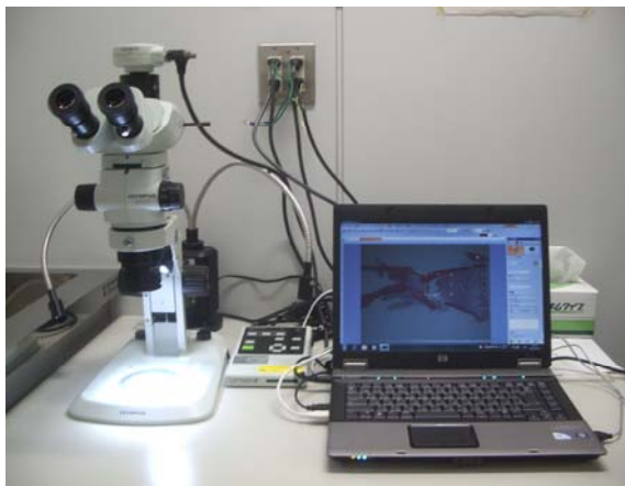
実体顕微鏡システム