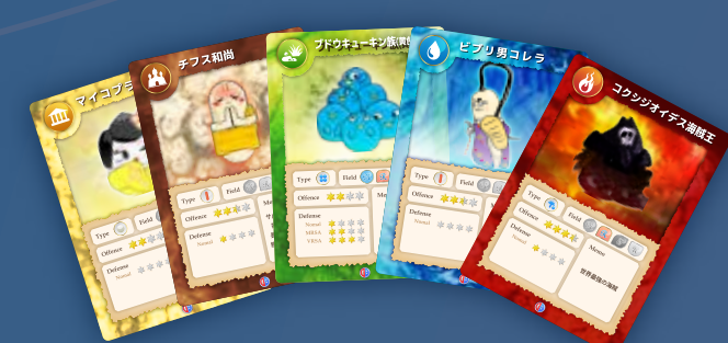
バイキンズカード